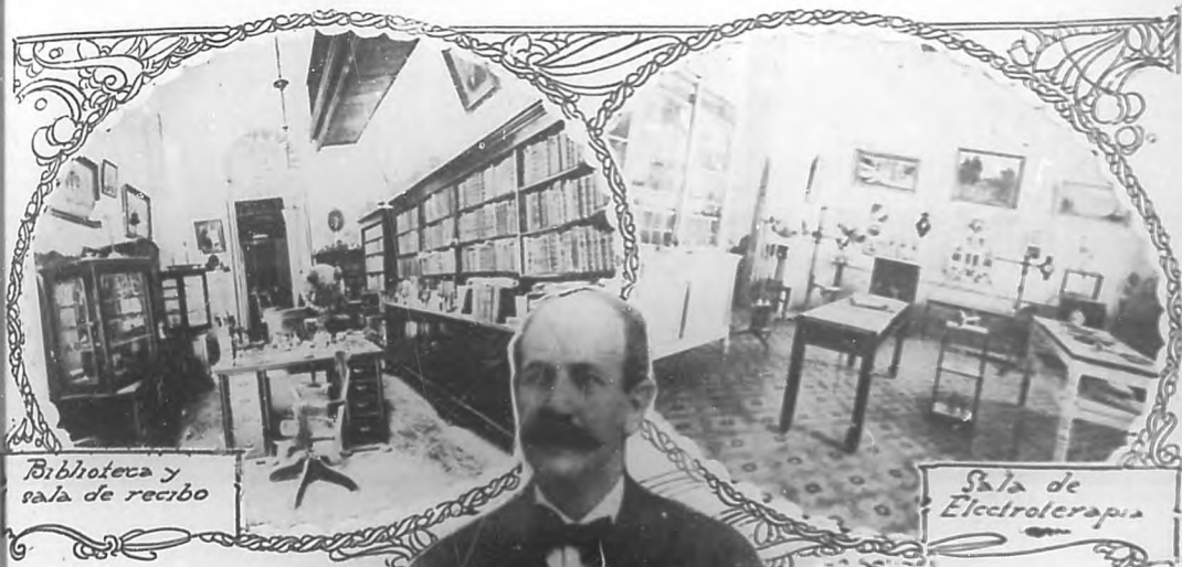
Biblioteca y sala de recepción

Se le debe también la importantísima obra de las manglaras que rodean la ciudad manzanera y cuya proximidad era causa de tantas enfermedades que se hacían epidémicas. La liberación de la playa de Bellamar, realizada merced a su trabajo, merece más de cuarenta mil metros cúbicos de refillón, y esta se llevó a cabo mediante el procedimiento de emparrillado. En esta obra, el doctor Escoto obtuvo