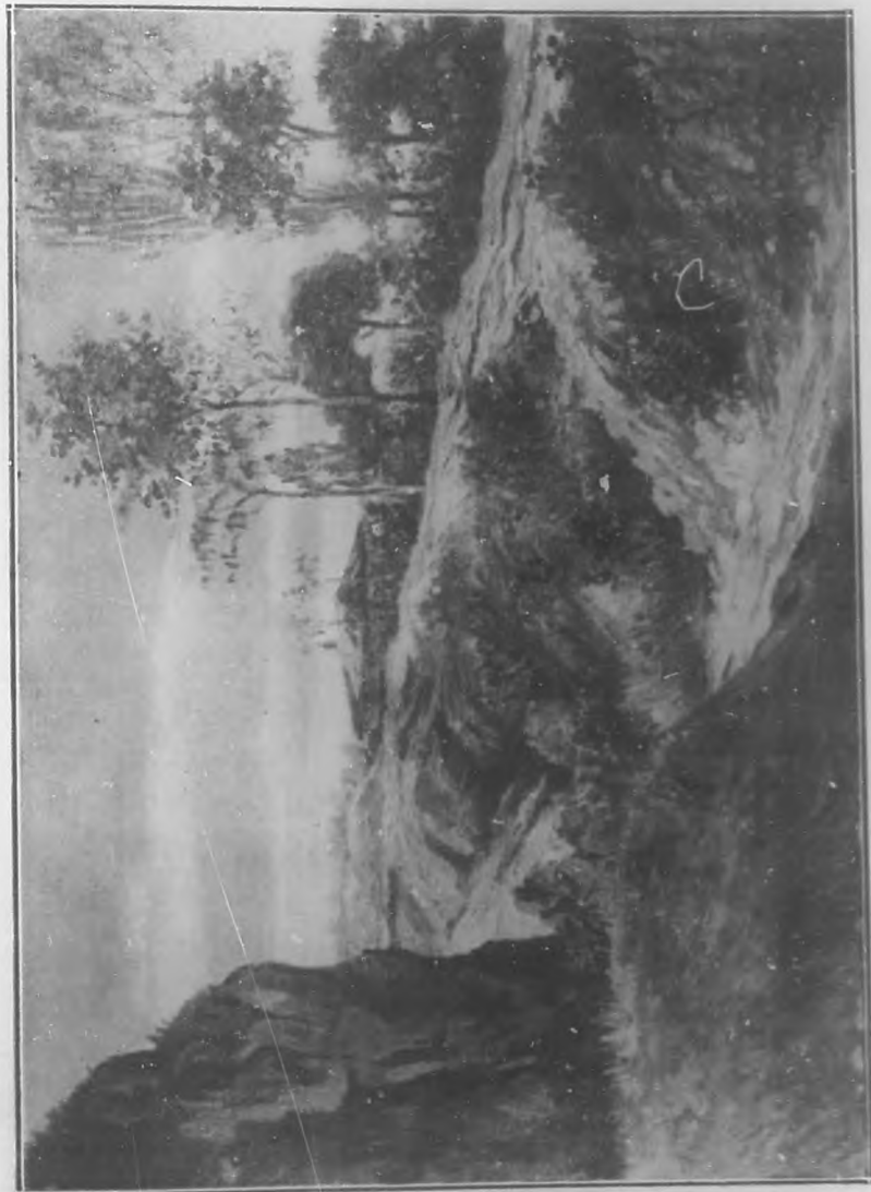
(Grabado troler de BOHEMIA.)