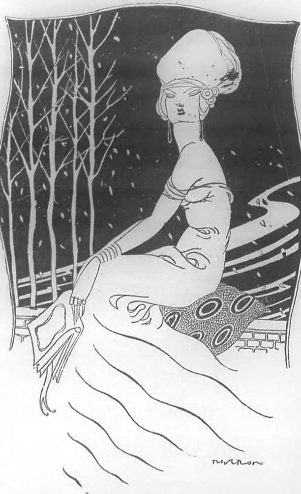
"Gloriana" quiere soñar y no puede... Ve las cosas por el lado vulgar, empeñándose en elevar altares a ídolos falsos. (Dibujo de Riverón.)