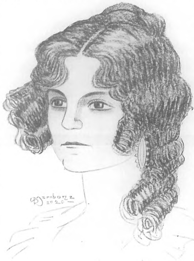
"Sus ojos tristes y hermosos toman una rara expresión de sueños visionarios..."

rollas en estridente colorines que ya van desvaneciéndose por pátina del tiempo inexorable.